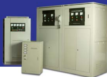
ESTABILIZADORES De 500VA a 1000KVA