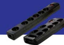
PROTECTORES DE SOBRETENSIONES