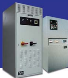
CONVERTIDORES Frecuencia y Tensión