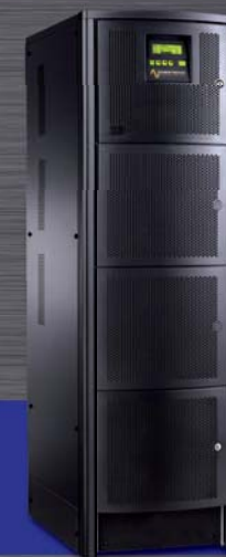
Modular System De 8KVA a 60KVA