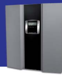
INVERSORES FILTRO ACTIVO