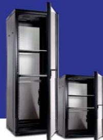
ARMARIOS RACK 19"