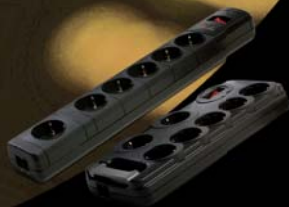
PROTECTORES DE SOBRETENSIONES

POWERTRONIX dispone de una amplia gama de equipamiento de electrónica de potencia, que ofrece soluciones integrales diseñadas para entornos domésticos y profesionales, y que mejoran la gestión, el rendimiento y la disponibilidad de sus equipos de red, de comunicaciones, electrónicos e industriales de cualquier dimensión. Todos los equipos están fabricados según las normativas vigentes de calidad nacionales e internacionales, por ello son capaces de garantizar un suministro eléctrico fiable, continuo, limpio y económico. La protección eléctrica inteligente es POWERTRONIX.