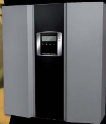
INVERSORES FILTRO ACTIVO