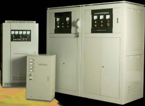
ESTABILIZADORES De 500VA a 1000KVA